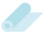
1 rouleau de plastique pour couvrir les livres