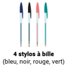
4 stylos à bille (bleu, noir, rouge, vert)