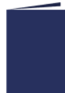
1 porte-vues 21 x 29,7 cm

100 vues minimum format A4 de bonne qualité (couverture translucide personnalisable )