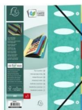
Trieur cartonné 24x32 6 positions