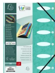
Trieur cartonné 24x32 - 6 positions