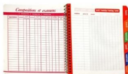
1 cahier de textes