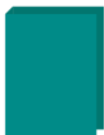
1 classeur rigide (21 x 29,7 cm)

1 ARDOISE blanche avec des stylos BLEUS (en prévoir plusieurs) et un chiffon propre .