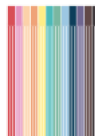
12 feutres de couleur