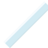
1 règle plate en plastique 20 cm