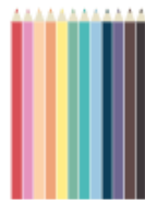
12 crayons de couleur