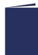
1 porte-vues 21 x 29,7 cm

100 vues minimum format A4 de bonne qualité (couverture translucide personnalisable )