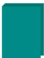
1 classeur rigide (21 x 29,7 cm)

1 ARDOISE blanche avec des stylos BLEUS (en prévoir plusieurs) et un chiffon propre .