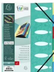
1 trieur cartonné 24x32 6 positions