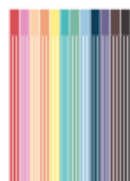
12 feutres de couleur

pointe moyenne pas de règle souple (pas pointus !) En prévoir plusieurs